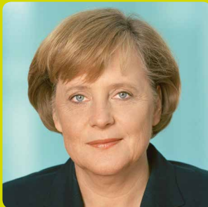
Bundeskanzlerin Dr. Angela Merkel, Schirmherrin der Charta der Vielfalt:

Innerhalb kürzester Zeit ist die Charta der Vielfalt zu einem der größten Diversity-Unternehmensnetzwerke Deutschlands und zu einem wichtigen Bestandteil der deutschen Arbeitswelt geworden. Über 2100 Unternehmen und Institutionen mit mehr als 7,4 Mio. Beschäftigten haben die Charta der Vielfalt als Selbstverpflichtung inzwischen unterschrieben und sich damit zu deren Grundsätzen bekannt.